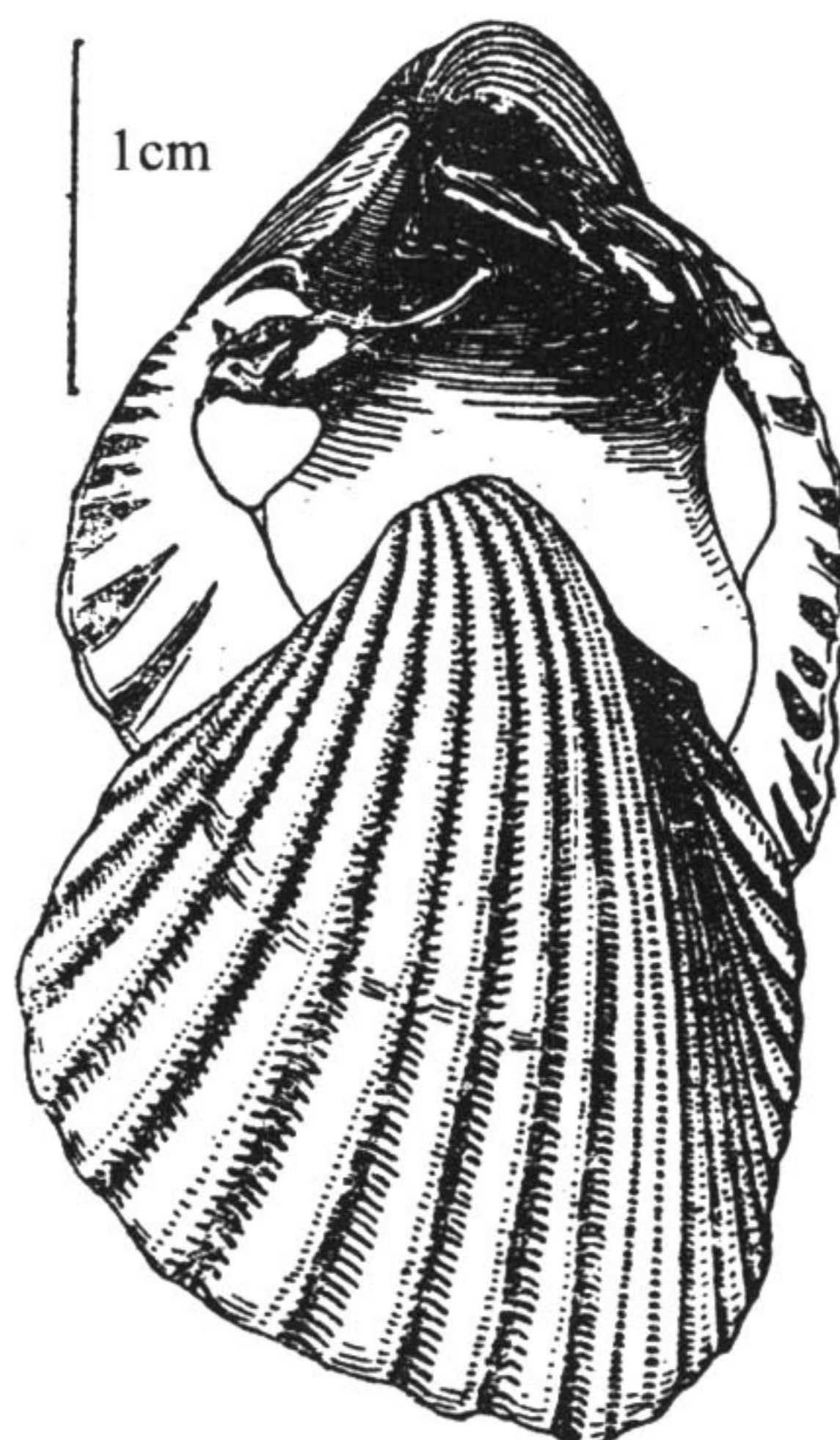
图 110 陷月鸟蛤 Lunulicardia retusa (Linnaeus) (仿张玺等, 1960)

Fragum (Lunulicardia) retusum (Linnaeus): Lamprell et Whitehead, 1992: pl. 37, fig. 207.